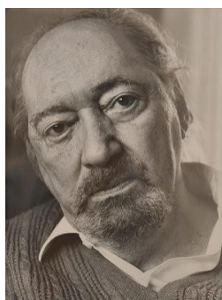
Juan Carlos Onetti